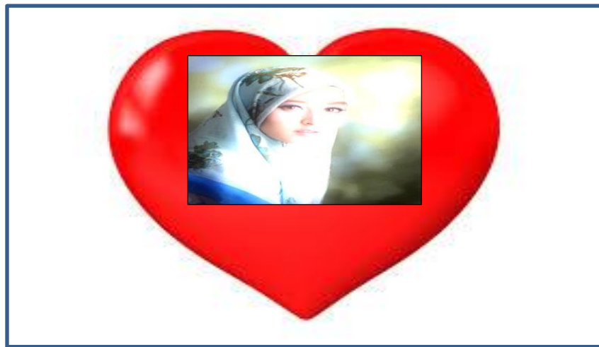
Rajah 2 Siang dan malam saya tak lupa, kasih terkandung dalam hati

Berdasarkan data dalam rajah 1 dan 2 di atas, frasa rindu di hati dan kasih terkandung dalam hati merujuk kepada ayat yang dikonsepsikan sebagai skema imej bekas. Dalam hal ini, pemahaman manusia tentang bekas adalah untuk menyimpan sesuatu. Jika dilihat dari sudut semantik kognitif, makna bagi hati adalah merujuk kepada sebahagian daripada organ dalaman yang tertutup. Secara zahirnya, memang tidak kelihatan kerana bentuknya yang abstrak. Hal ini kerana, apa sahaja yang berkait rapat dengan perasaan ataupun emosi sukar untuk dibaca kerana berada dalam hati dan diri. Tambahan lagi, jika dianalisis frasa rindu di hati datang melanda , hati dianggap sebagai bekas dan rasa rindu dianggap sebagai suatu entiti yang terkumpul (bergumpal) dengan banyak (seribu satu) ke dalam bekas (hati). Kasih pula dianggap sebagai rasa yang disimpan dalam suatu bekas iaitu hati .