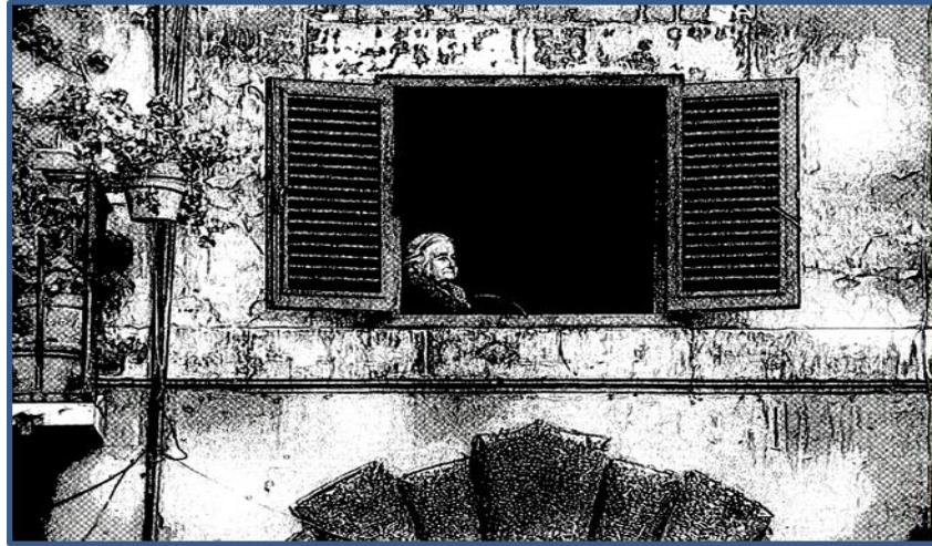
Rajah 1 Rindu di hati datang melanda, air mata jatuh ke pipi.