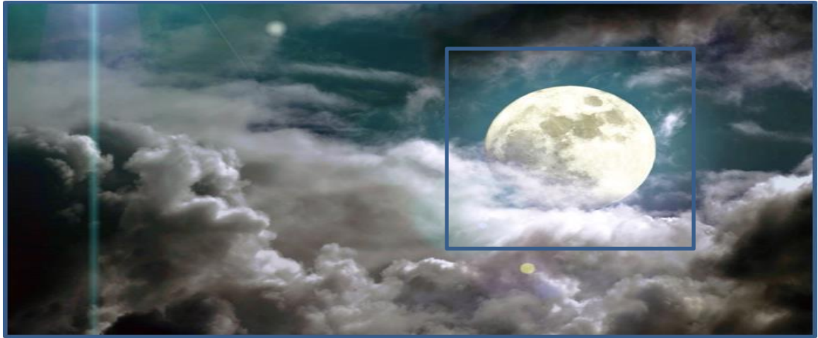
Rajah 5 Cantik bulan di kaki awan, memancar-mancar mengeluarkan cahaya

Dalam data di atas, frasa memancar-mancar mengeluarkan cahaya merupakan maklumat pinggiran yang diberi perumpamaan kepada maklumat teras iaitu frasa cantik bulan di kaki awan . Data ini membawa maksud perempuan yang jarang-jarang keluar rumah dan kelihatan sangat cantik.