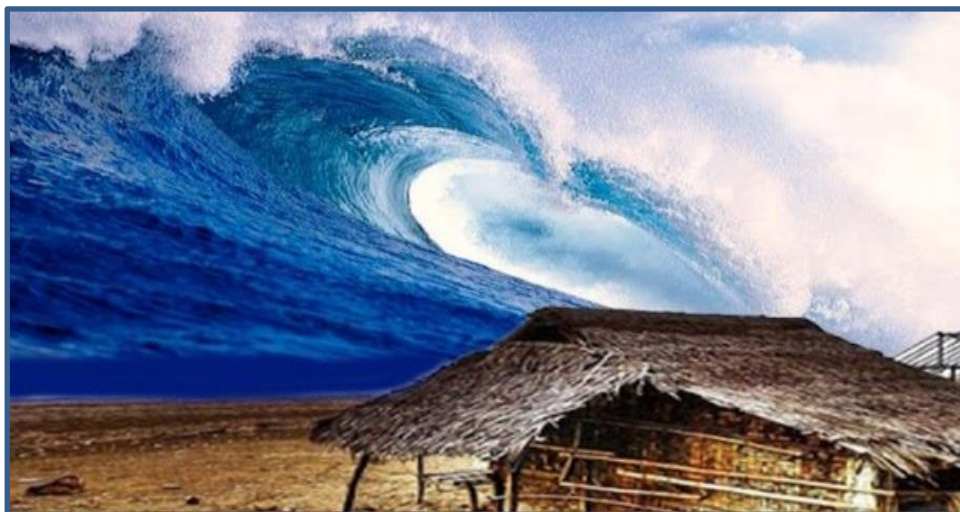
Rajah 4 Kalau kutakut dilambung ombak, tak ku berumah di tepi pantai

Leksikal dilambung merujuk kepada satu pergerakan. Dalam data di atas, leksikal dilambung dikonsepsikan kepada interaksi yang konkrit iaitu tak ku berumah di tepi pantai . Daya sumber diwakili oleh ungkapan kalau ku takut dilambung ombak , manakala elemen sasaran merujuk kepada tak ku berumah di tepi pantai . Leksikal dilambung merupakan suatu daya pergerakan naik atau dibuang ke atas tinggi-tinggi. Data ini membawa maksud seseorang yang takut berhadapan dengan penderitaan, tidak akan melakukan sesuatu yang boleh mendatangkan kesusahan kepada diri sendiri melainkan perkara tersebut telah difikirkan terlebih dahulu.