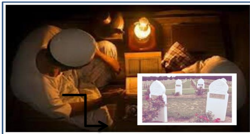
Rajah 7 Hidup di dunia buat amalan, untuk bekalan akhirat nanti

Berdasarkan data di atas, sememangnya hidup di dunia adalah sebagai persinggahan dalam meniti kehidupan. Dalam menjalani kehidupan di dunia ini, manusia hendaklah berusaha dan bekerja keras untuk kesenangan dan kekayaan tanpa melupakan akhirat. Dunia diibaratkan sebagai jambatan manusia untuk ke akhirat. Oleh sebab dunia yang bersifat sementara, maka semasa hidup di dunia seseorang itu hendaklah melakukan ibadat dan amalan kebaikan sebagai bekalan di akhirat kelak.